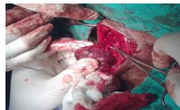
Fig1 : image per opératoire d'une thyroïdectomie totale chez un Homme

Le recul moyen dans notre étude était de 36 mois