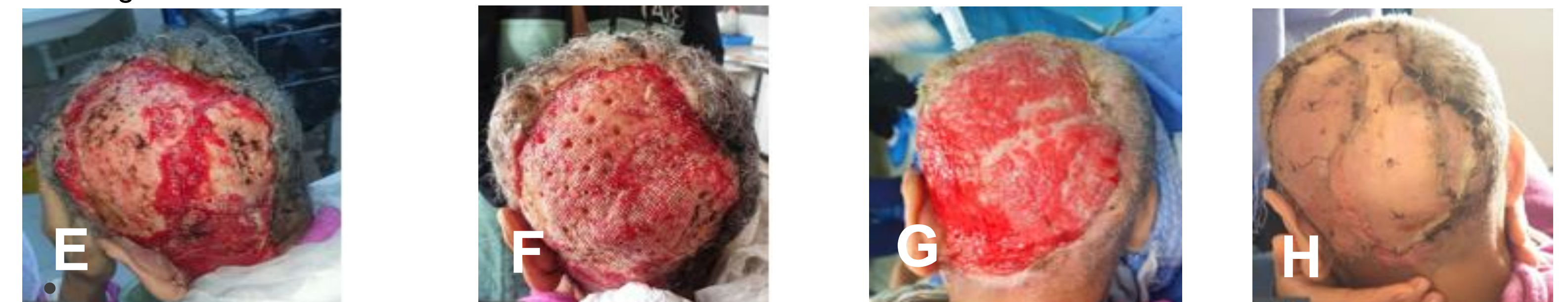
Fig E :PDS étendue et complexe(scalp et corticale externe de l'os).Fig F: trépanation de la corticale externe. Fig G:bourgenement à 1 mois post opératoire. Fig H: greffe de peau mince